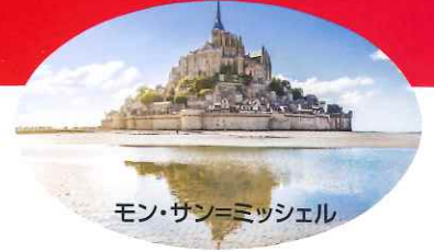
モン・サン=ミッシェル